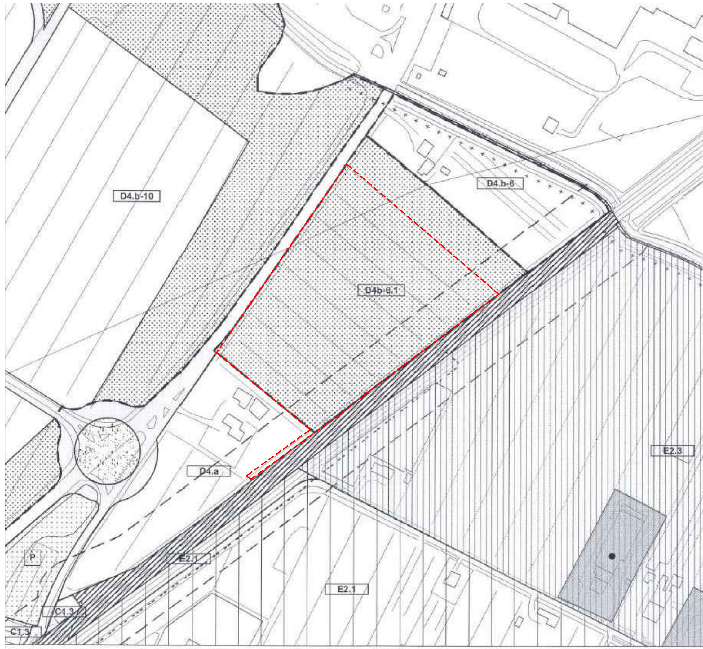
ESTRATTO EX P.I. SCALA 1:2000 V.P.R.G. per la Terraferma approvato con DGRV n. 3905 del 03.12.2004